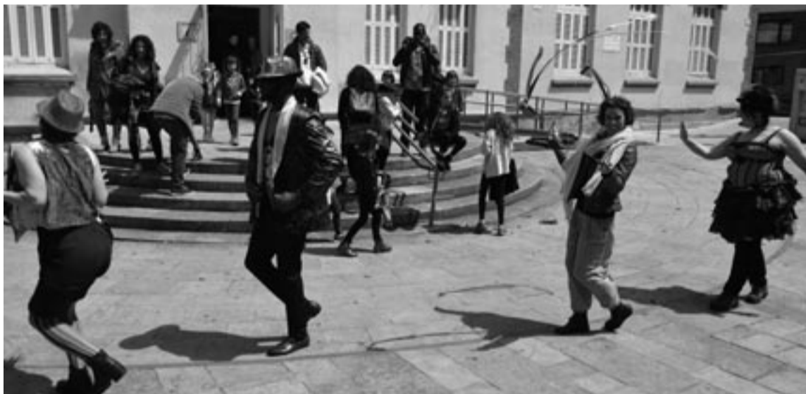
'Pinoccio' ikustera joan zirenak Biteritik irteretakoan 'Lur Ikara' somatu zuten.