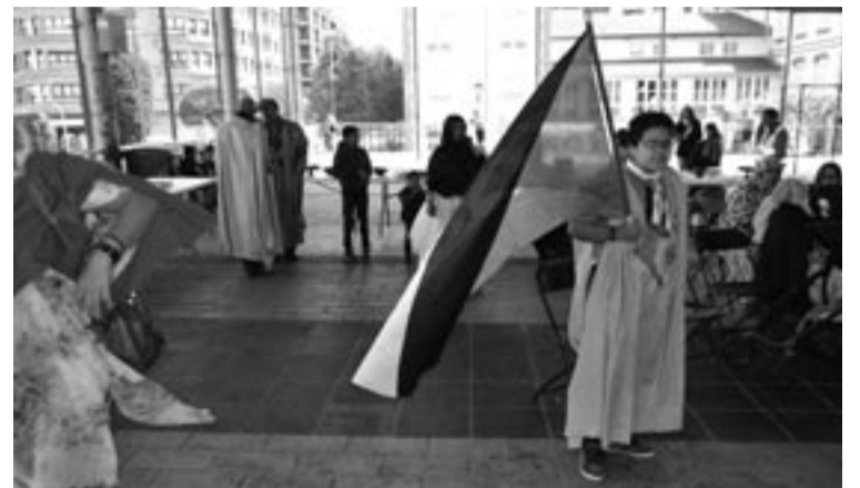
Sahararak Atsegindegian bildu ziren beraien banderekin.