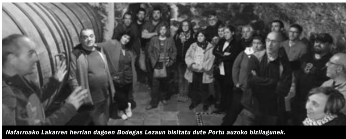
Nafarroako Lakarren herrian dagoen Bodegas Lezaun bisitatu dute Portu auzoko bizilagunek.

egitearen eta azoka egitearen bueltan. Era berean, webgunea erabiltzeko tailerra edota wifia kolektibizazioa burutzeari buruzko proposamenak ere landuko dira. ||