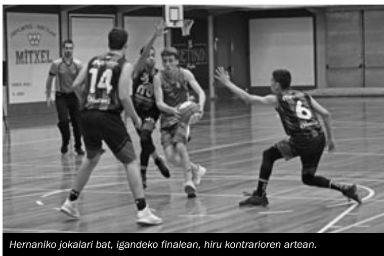
Hernaniko jokalaririk bat, igandeko finalean, hiru kontrarioen artean.

Horrela, Hernani eta Mondragon Unibertsitatea aritu ziren finalean, eta partidu estua eta lehiatua, kanpokoak nagusitu ziren azkenean (63-68). Hernani Txiki, berriz, galdu egin zuen hirugarren posturako lehia, Aloña Mendiren aurka (41-63). Zaleen animorik ez zuten falta izan bi talde hernania-