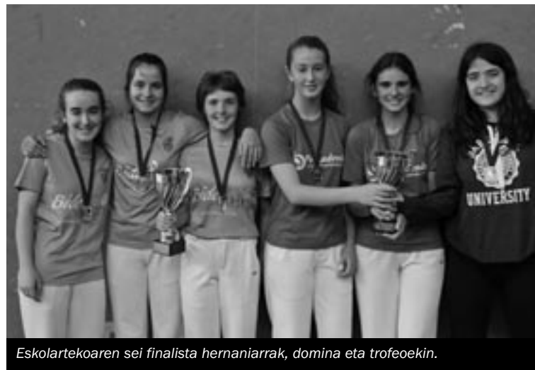
Eskolartekoaren sei finalista hernaniarrak, domina eta trofeoekin.