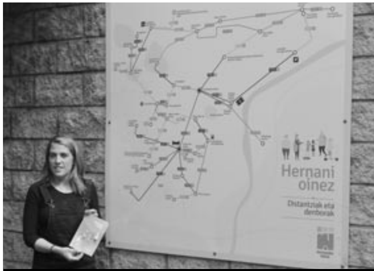
Kiroldegiko zerbitzu berriez gain, herriko oinezko bideen berri eman zuen zinegotziak.

Familiei begira ere, espazio berri bat jarri da martxan, hain zuzen, «familia kontziliazioa erraztu nahian». Gela bat haurrentzako ludoteka izateko egokitu da. Erabilera librekoa, zaintzarik gabea, eta txikiengatik prestatuko materialez osatutakoa izango da: irakurketa txokoa, eraikuntza