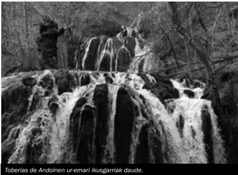
Toberias de Andoinen ur-emari ikusgarriak daude.