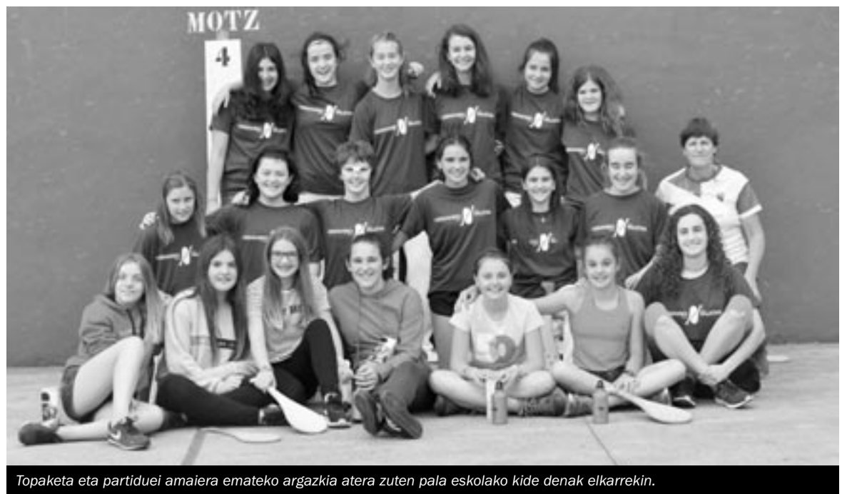
Topaketa eta partiduei amaiera emateko argazkia atera zuten pala eskolako kide denak elkarrekin.

Pasa den ostiralean giro bikainarekin ospatu ziren pala eskolako jarduerak. Tilosetan finalak jokatu ziren eta infan-