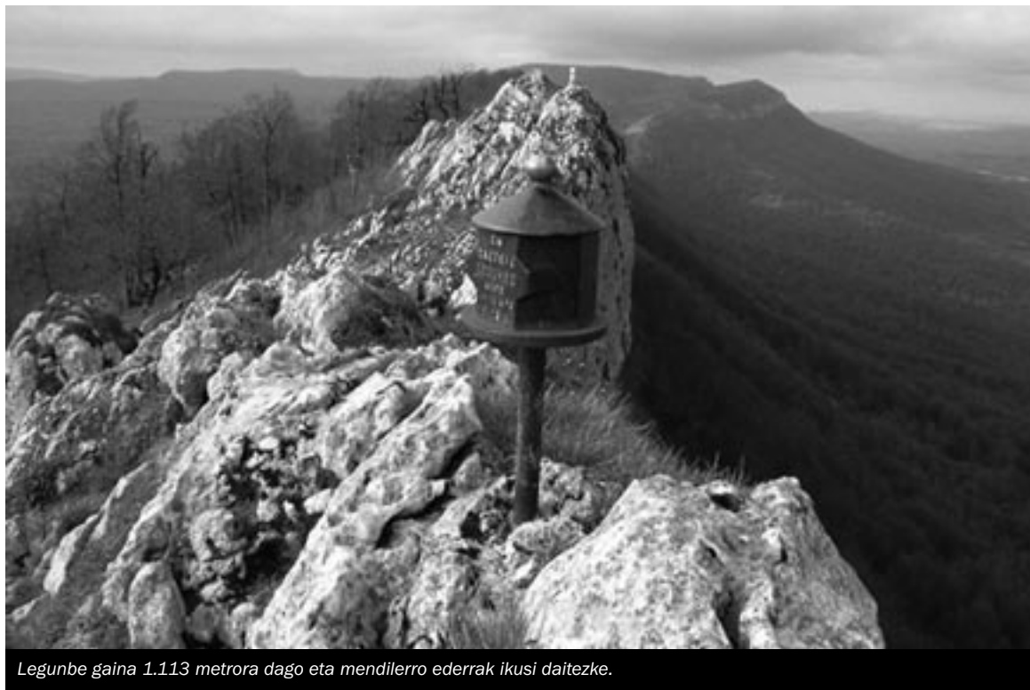
Legunbe gaina 1.113 metrora dago eta mendilerro ederrak ikusi daitezke.

Legunbe mendiak ipar aldera, Araiako bailara aldera, amildegiz izugarriak erakusten ditu eta hego aldera aldiz, magal leunak. Mendiak bi gailur ditu. Bien artean Legunbeko Haitzuloa izenarekin ezagutzen den zuloa aurkituko dute. Iraia aldera irekitzen den leiho naturala da. Zulo haundi batez eta beste txiki batez osatuta dago. Bi gailurretatik mendebaldekoa Arabako lurretan kokatuta dago eta ekialdekoa Araba eta Nafarroan. Mugen zehaztasunarekin beti gatazkak egon zirenez, 1928 urtean bi probintzien arteko muga zehaztuko zuen harritzko hesia eraiki zen. Hortik