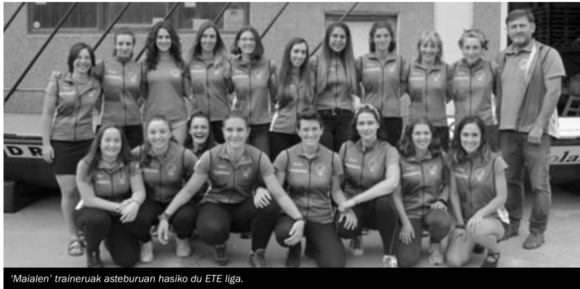
'Maialen' traineruak asteburuan hasiko du ETE liga.