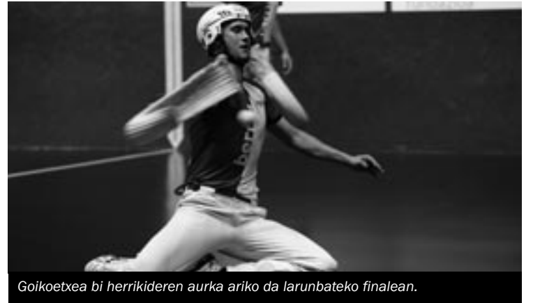
Goikoetxea bi herrikideren aurka ariko da larunbateko finalean.