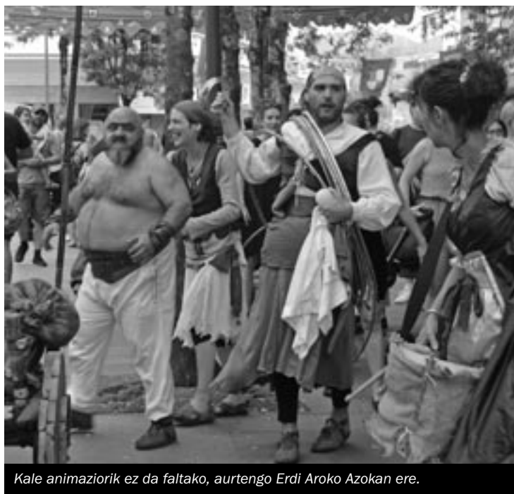
Kale animaziorik ez da faltako, aurtengo Erdi Aroko Azokan ere.

Udaberrira bueltan azoka, udara bukaeran beharrean Aurreko bi urteotan udara bukaeran egin ondoren, lehengo datara bueltatuko da Erdi Aroko Azoka; udaberrira, hain zuzen ere. Hernani Errotzen elkarteak, Hernaniko Udalak, eta N-KO Soluciones Eléctricas eta Events & Press enpresak antolatu dute. ■