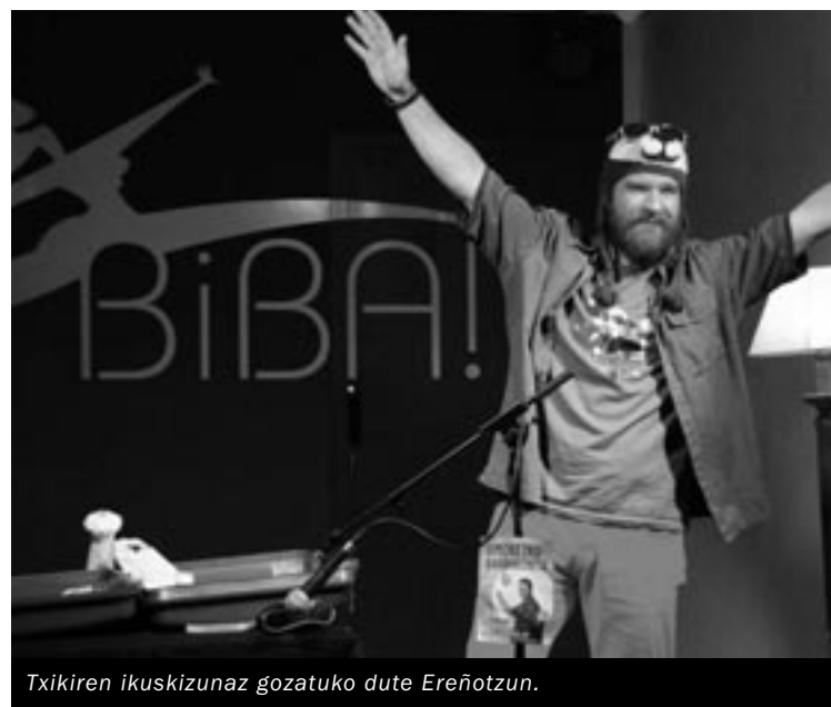
Txikiren ikuskizunaz gozatuko dute Ereñotzun.

Denentzat, noski. Bakarriketa hau otsailean estreinatu nuen Donostiako poltsiko jaialdiaren barruan, eta harrera oso ona izan du adin ezberdineko publikoaren artean. Hala ere, bakarriketa berri honek 25 urtetik 60 urte bitarteko artean enkaxatzen du ondoen, baina titulu bat jarri behar nion ta hori bururatu zitzaidan, Huntzaren abesti famatua erabiliz.