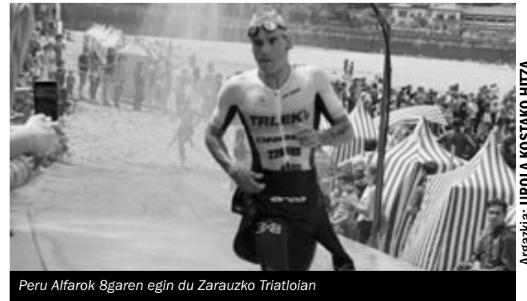
Peru Alfaro 8garren egin du Zarauzko Triatloian