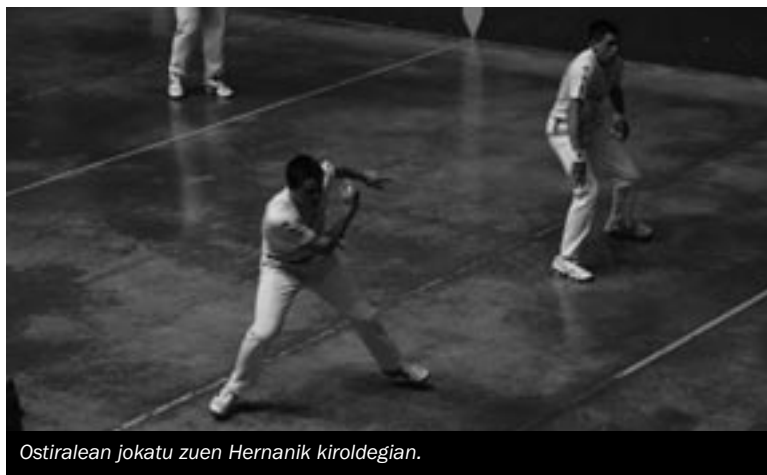
Ostiralean jokatu zuen Hernanik kiroldegian.

Orain, finalerdia Ataunen aurka jokatuko dituzte, eta badauzkate aukerak, finalera iristeko. Ataundarrek Tolosa kanporatu dute, tanteoarengatik. Hiruna berdindu zuten, baina asko sufritu zuten ataundarrek