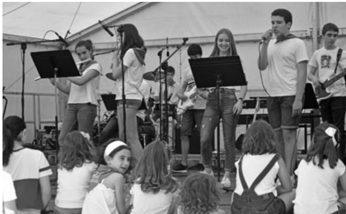
Makina bat kontzertu eskaini zituzten bi egunetan. Gehienek, Musika Eskolako zapi berdea zeramakiten lepoan.