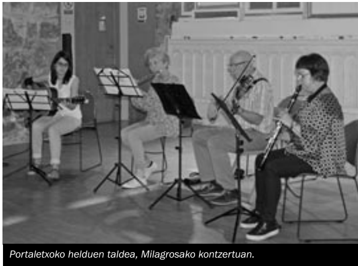
Portaletxoko helduen taldea, Milagrosako kontzertuan.

Ikasle gaztetxoek bezala, ikasturtea agurtzeko, kontzertu bat eskaini zuen maiatzaren 31n, Hernani Musika Eskolako Portaletxoko helduen ganbara taldeak. Milagrosara eraman zituzten beraien doinuak, eta bost instrumentu ezberdinen doinuen nahasketarekin, goxatu zituzten bertaratuen belarriak. ■