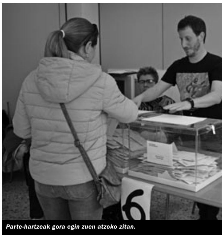
Parte-hartzeak gora egin zuen atzoko zitan.