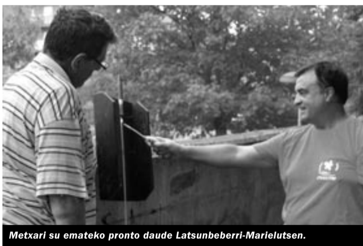
Metxari su emateko pronto daude Latsunbeberri-Marielutsen.

Etzi, goizetik hasiko da eguna, 10:00etatik 12:00etara bitartean, betiko jokoak egongo dira, hala nola, zaku lasterketa, zapi jokia eta mahai futbola. Jarraian, marrazki lehiaketan parte hartu dutenek, beren lanak entregatu beharko dituzte, ondoren sariak egongo baitira. Esku pelota txapelketa ere ez da faltako, eta hau amaitzean, trikitilari eta buruhaundiak egongo dira auzoan zehar. Hauek bukatuta, umeentzako aparraren jaiak izango da, eguraldi ona