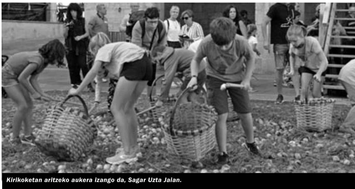
Kirikoketan aritzeko aukera izango da, Sagar Uzta Jaian.

Sagar Uzta jaiaren hemeretzigarren edizioa izango da irailaren 26tik 29ra; eta larunbat horretan egingo dute Sagardo Txapelketa herrikoia finala, Ergobiako plazan.