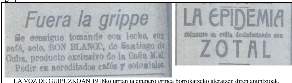
LA VOZ DE GUIPUZKOAN 1918ko urrian ia egunero gripea borrokatzeko ateratzen diren anuntzioak.

Kontestuan jartzeko “La Voz de Guipuzcoa” 1918ko egunkaria irakurriz, irailaren hasieran gripearen aipamenik gutxi egiten dela ikusten da. Donostiako “beraneo”, kontzertu ekonomikoa, Europako gerla, Errusiako egoera, eta bestelakoak dira berri nagusiak. Baina gripearen lehen aipamen larria Nafarroatik dator, non egunkariak, 1918ko irailaren 9an, Iruñean duen korrespontsalak Goizuetan herritar asko gaixotu eta zenbait herritar hil dela azaltzen du. Ez da gripea aipatzen baina inguruko herrietan alarmak pizten dira. Urriaren hasieran hasten da gripeak garrantzia hartzen, eta egunkariaren lehen orrian leku garrantzitsua izango du. Urrian, Europan amaitzean dagoen lehen gerlarekin eta errusiaren egoerarekin batera, gripeak jarraituko du gai nagusia izaten. Horrela herrietan dauden gripe kasuak, instituzioek gripea epidemiaren aurrean hartzen dituzten neurriak, gripea kontrolatzeko mugaren kontrolak eta itxierak, afektatuei laguntzeko jasotzen diren laguntzak, kutsatzeko beldurrez gertatzen diren egoerak (adibidez laguntzaren faltaz Bilbon bere burua hiltzen duen gizon batena), e.a. dira egunkarian, La Voz de Guipuzcoan, azaltzen diren gripearekin lotutako berriak.