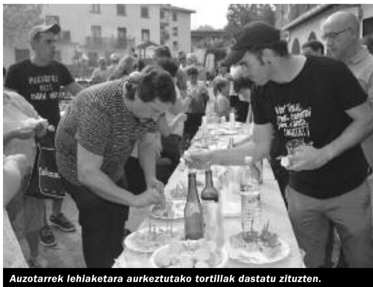
Auzotarrek lehiaketara aurkeztutako tortillak dastatu zituzten.