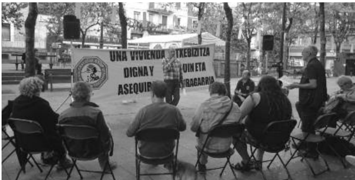
Urriaren 4an kontzentrazioa antolatu zen eta hitzaldia eskaini zen Plaza Berrin.