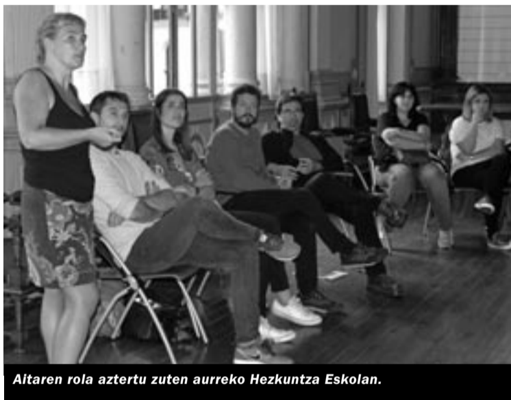
Aitarek aztertu zuten aurreko Hezkuntza Eskolan.

Eta horrekin jarraituz, gurasoek edota haurren arduerdunek izan ditzazketen beste hainbat kezka ere jarri-