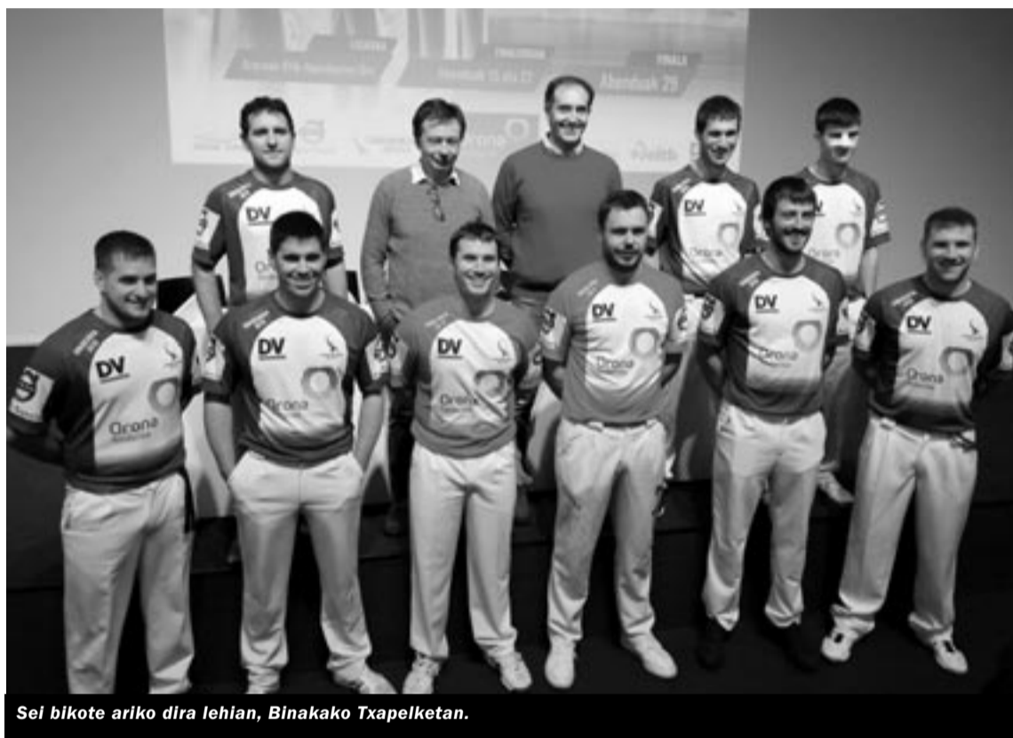
Sei bikote ariko dira lehia, Binakako Txapelketan.

Abenduaren 15ean eta 22an izango dira finalerdiko bi partiduak; ondoren, abenduaren 29an jokatu dute finala, bi bikote onenek.