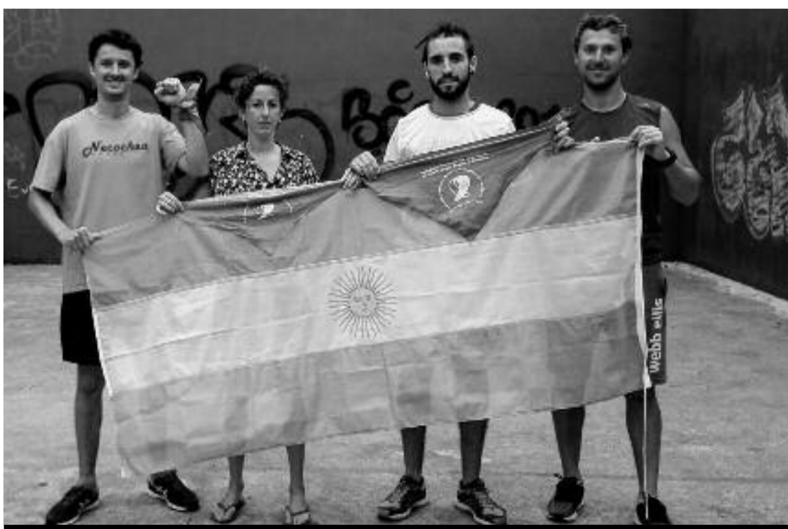
Hernanin bizi edo dabiltzan argentinarrak herenegun 'Legezkoa izan dadila' aldarrikatzen.